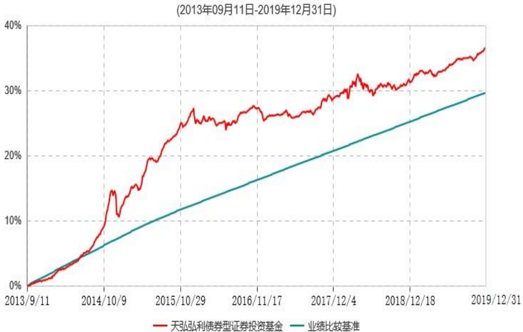
天弘弘利债券型证券投资基金累计净值增长率与业绩比较基准收益率历史走势对比图

注：1、本基金合同于2013年09月11日生效。 2、本报告期内，本基金的各项投资比例达到基金合同约定的各项比例要求。