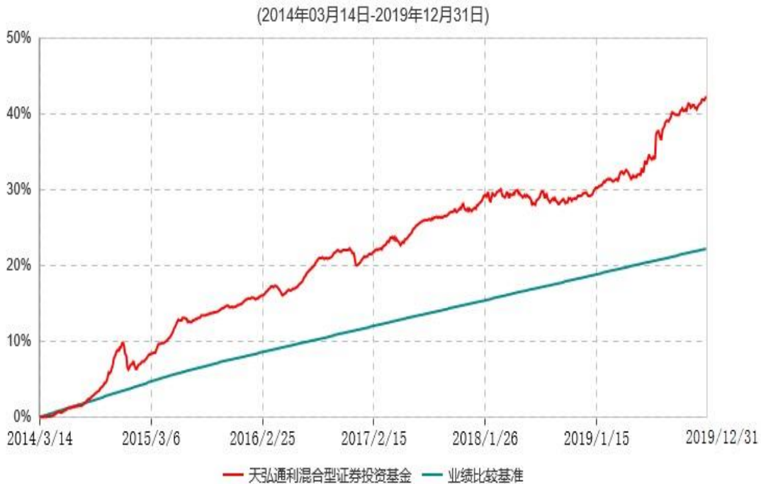
天弘通利混合型证券投资基金累计净值增长率与业绩比较基准收益率历史走势对比图

注：1、本基金合同于2014年03月14日生效。 2、本报告期内，本基金的各项投资比例达到基金合同约定的各项比例要求。