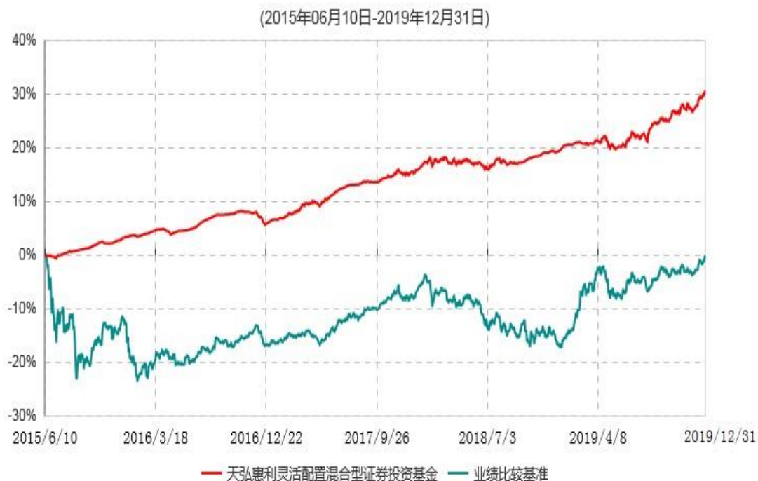
天弘惠利灵活配置混合型证券投资基金累计净值增长率与业绩比较基准收益率历史走势对比图