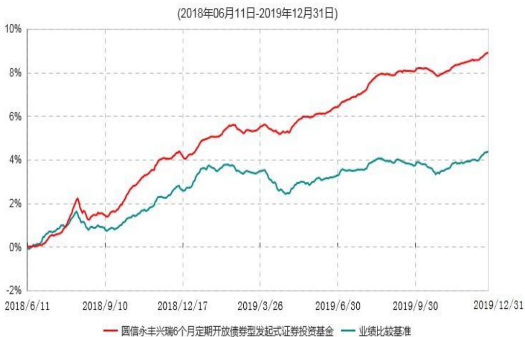
圆信永丰兴瑞6个月定期开放债券型发起式证券投资基金累计净值增长率与业绩比较基准收益率历史走势对比图