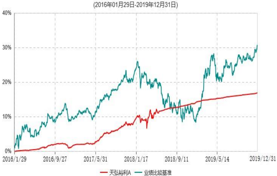
天弘裕利A累计净值增长率与业绩比较基准收益率历史走势对比图