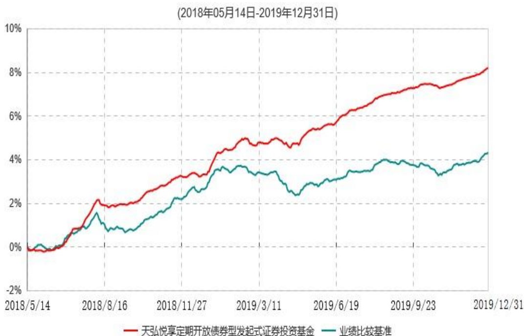
天弘悦享定期开放债券型发起式证券投资基金累计净值增长率与业绩比较基准收益率历史走势对比图