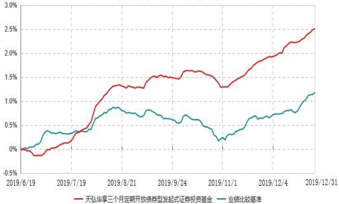
天弘华享三个月定期开放债券型发起式证券投资基金累计净值增长率与业绩比较基准收益率历史走势对比图 (2019年06月19日-2019年12月31日)

注：1、本基金合同于2019年06月19日生效，本基金合同生效起至披露时点不满1年。 2、按照本基金合同的约定，基金管理人应当自基金合同生效之日起6个月内使基金的投资组合比例符合基金合同的有关约定。本基金的建仓期为2019年06月19日至2019年12月18日，建仓期结束时及至报告期末，各项资产配置比例均符合基金合同的约定。