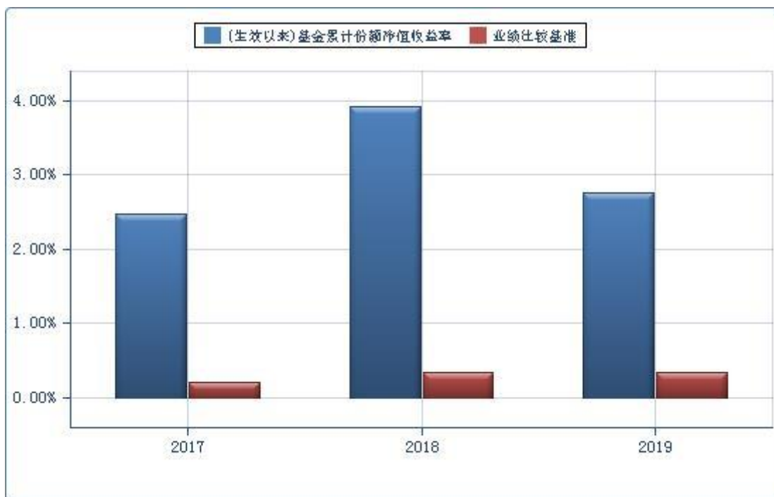
信诚 28 日盈 B: