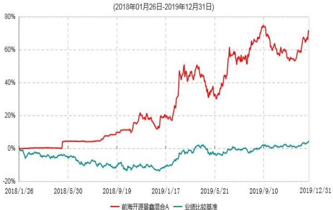
前海开源景鑫混合A累计净值增长率与业绩比较基准收益率历史走势对比图