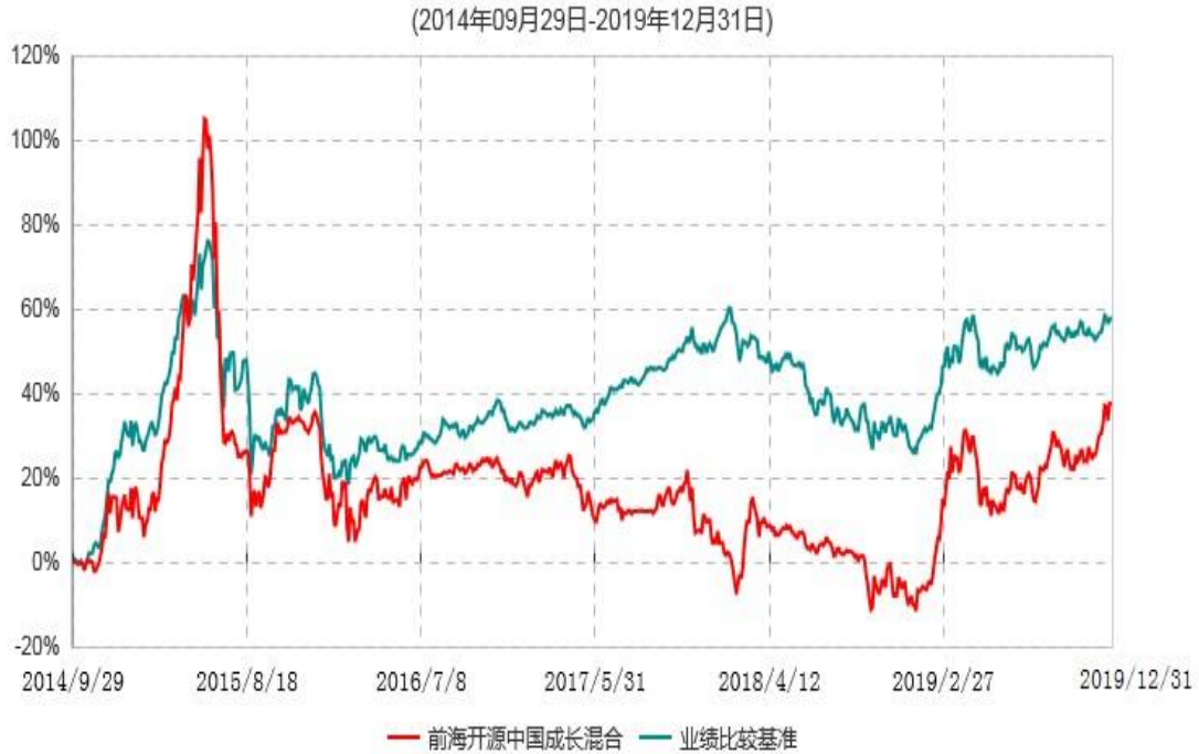
前海开源中国成长灵活配置混合型证券投资基金累计净值增长率与业绩比较基准收益率历史走势对比图