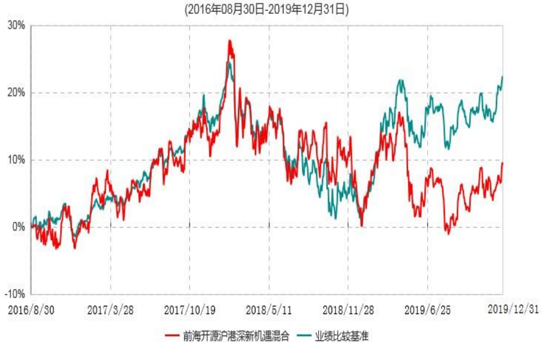
前海开源沪港深新机遇灵活配置混合型证券投资基金累计净值增长率与业绩比较基准收益率历史走势对比图