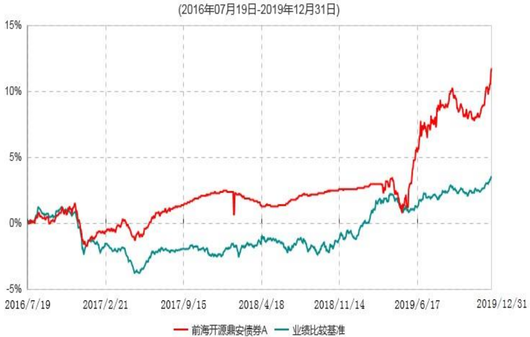
前海开源鼎安债券A累计净值增长率与业绩比较基准收益率历史走势对比图