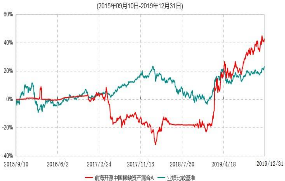
前海开源中国稀缺资产混合A累计净值增长率与业绩比较基准收益率历史走势对比图