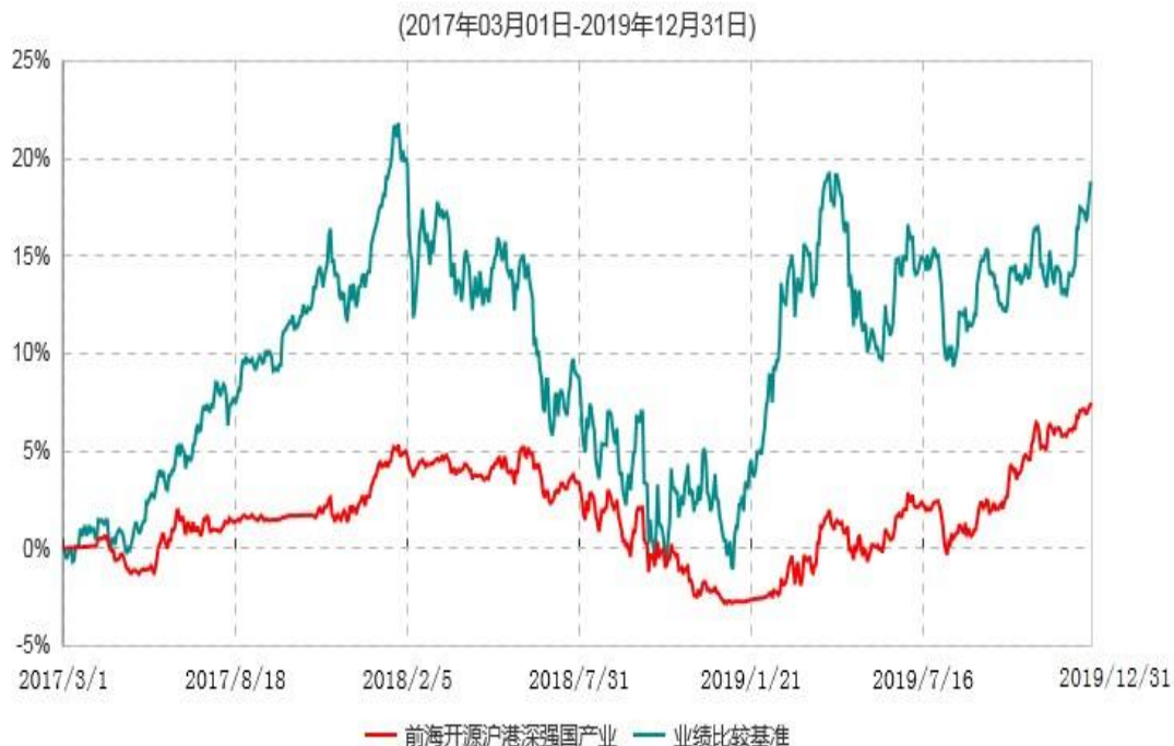
前海开源沪港深强国产业灵活配置混合型证券投资基金累计净值增长率与业绩比较基准收益率历史走势对比图