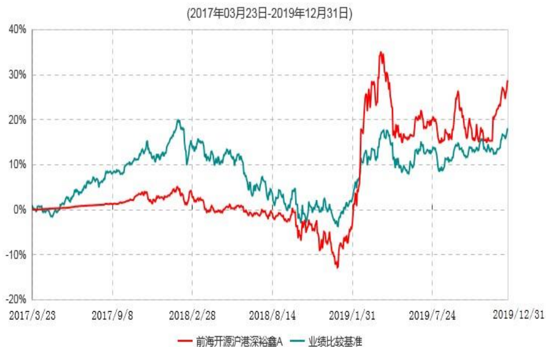
前海开源沪港深裕鑫A累计净值增长率与业绩比较基准收益率历史走势对比图