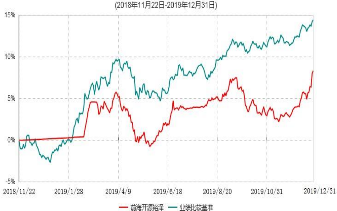
前海开源裕泽定期开放混合型基金中基金（FOF）累计净值增长率与业绩比较基准收益率历史走势对比图

注：本基金的建仓期为6个月，建仓期结束时各项资产配置比例符合基金合同规定。截至2019年12月31日，本基金建仓期结束未满1年。