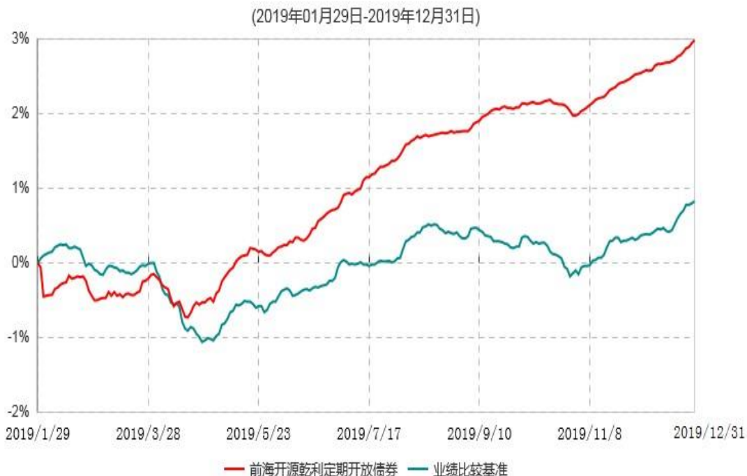
前海开源乾利3个月定期开放债券型发起式证券投资基金累计净值增长率与业绩比较基准收益率历史走势对比图

注：①本基金的基金合同于2019年1月29日生效，截至2019年12月31日止，本基金成立未满1年。