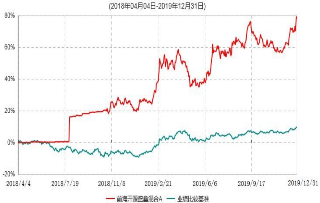
前海开源盛鑫混合A累计净值增长率与业绩比较基准收益率历史走势对比图