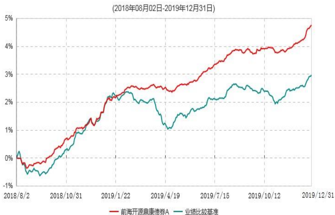
前海开源鼎康债券A累计净值增长率与业绩比较基准收益率历史走势对比图