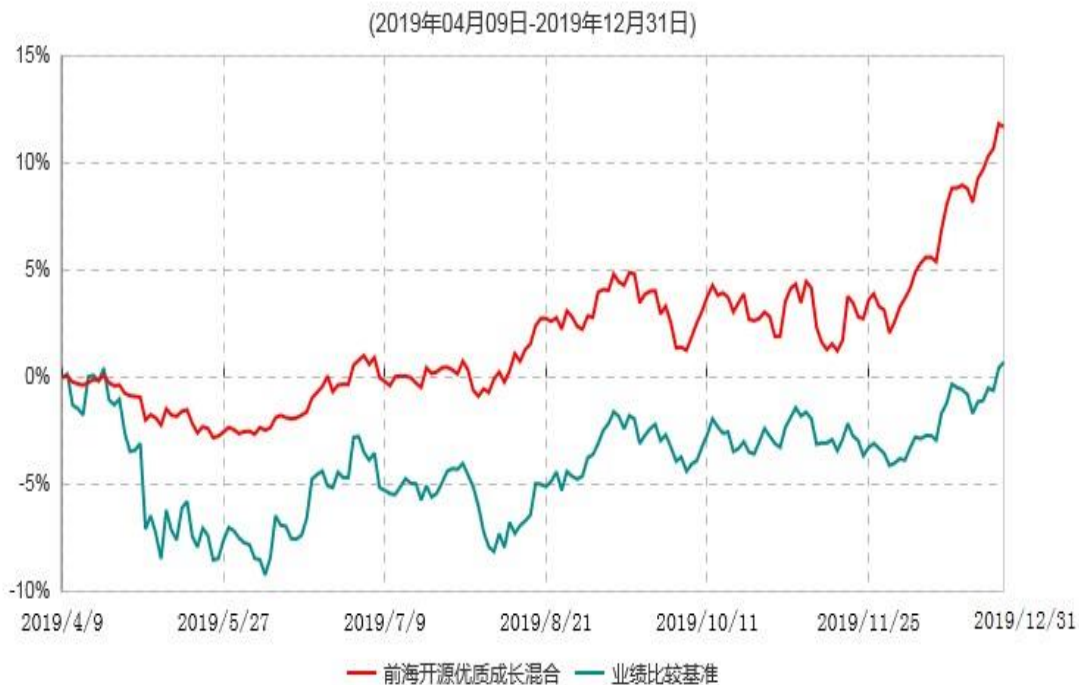
前海开源优质成长混合型证券投资基金累计净值增长率与业绩比较基准收益率历史走势对比图

注：①本基金的基金合同于2019年4月9日生效，截至2019年12月31日，本基金成立未满1年。