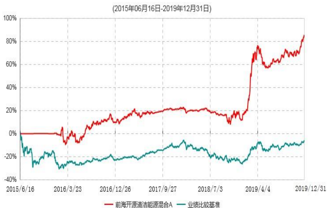
前海开源清洁能源混合A累计净值增长率与业绩比较基准收益率历史走势对比图