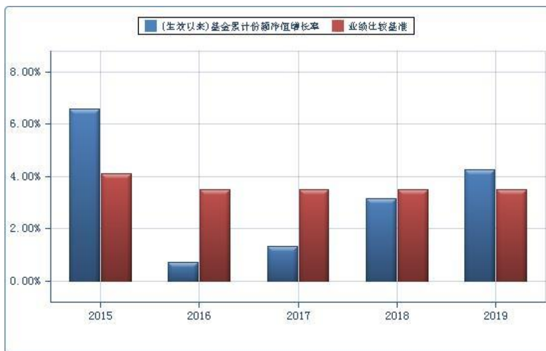
信诚年年有余定期开放债券 B: