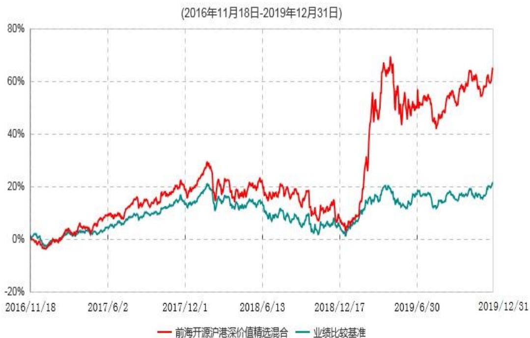
前海开源沪港深价值精选灵活配置混合型证券投资基金累计净值增长率与业绩比较基准收益率历史走势对比图