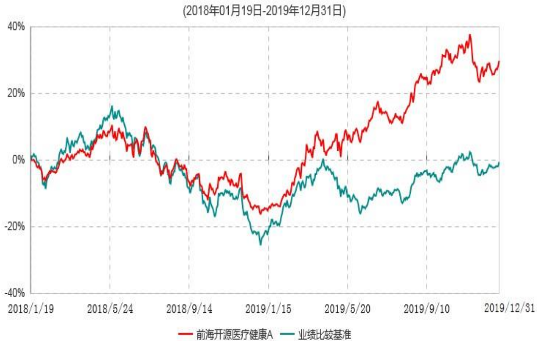
前海开源医疗健康A累计净值增长率与业绩比较基准收益率历史走势对比图