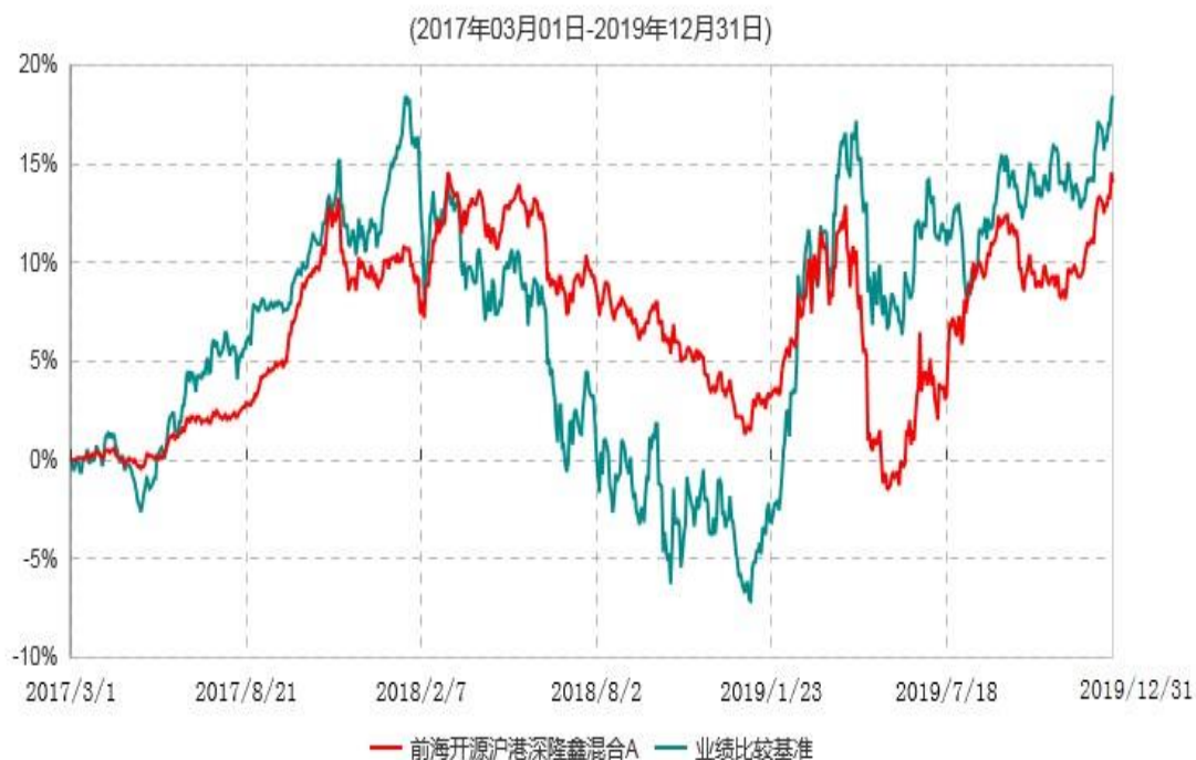
前海开源沪港深隆鑫混合A累计净值增长率与业绩比较基准收益率历史走势对比图