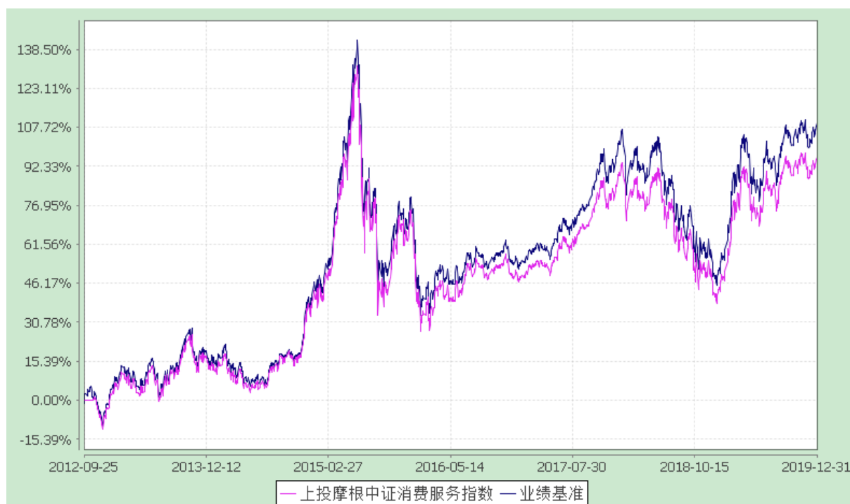
上投摩根中证消费服务领先指数证券投资基金 自基金合同生效以来份额累计净值增长率与业绩比较基准收益率的历史走势对比图 (2012 年 9 月 25 日至 2019 年 12 月 31 日)

注：本基金合同生效日为 2012 年 9 月 25 日，图示时间段为 2012 年 9 月 25 日至 2019 年 12 月 31 日。本基金建仓期自 2012 年 9 月 25 日至 2013 年 3 月 24 日,建仓期结束时资产配置比例符合本基金基金合同规定。