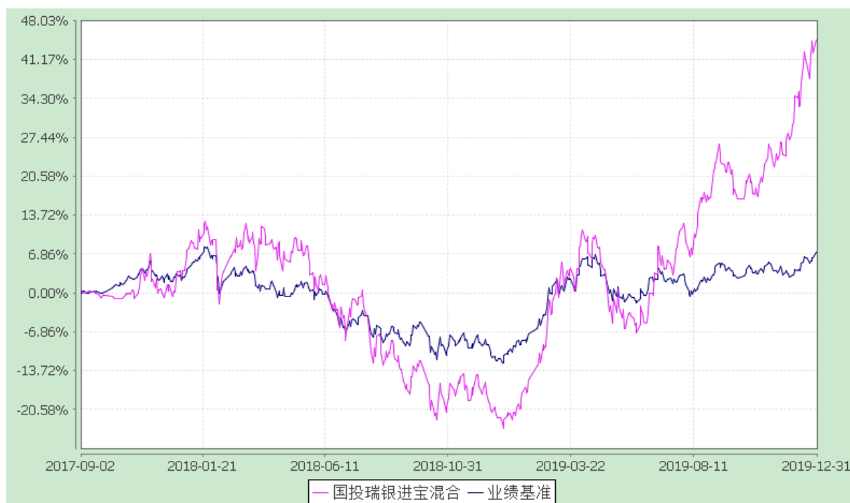
国投瑞银进宝灵活配置混合型证券投资基金 份额累计净值增长率与业绩比较基准收益率的历史走势对比图 (2017 年 9 月 2 日至 2019 年 12 月 31 日)

注：1、本基金由国投瑞银进宝保本混合型证券投资基金转型而来并于 2017 年 9 月 2 日合同生效，上图报告期间的起始日为 2017 年 9 月 2 日。