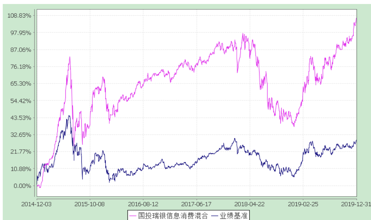
国投瑞银信息消费灵活配置混合型证券投资基金 份额累计净值增长率与业绩比较基准收益率的历史走势对比图 (2014 年 12 月 3 日至 2019 年 12 月 31 日)

注：本基金建仓期为自基金合同生效日起的 6 个月。截至建仓期结束，本基金各项资产配置比例符合基金合同及招募说明书有关投资比例的约定。