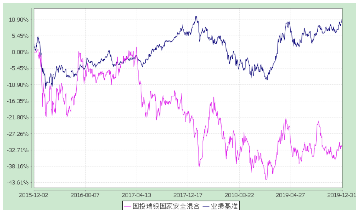
国投瑞银国家安全灵活配置混合型证券投资基金 份额累计净值增长率与业绩比较基准收益率的历史走势对比图 (2015 年 12 月 2 日至 2019 年 12 月 31 日)

注：本基金建仓期为自基金合同生效日起的 6 个月。截至建仓期结束，本基金各项资产配置比例符合基金合同及招募说明书有关投资比例的约定。