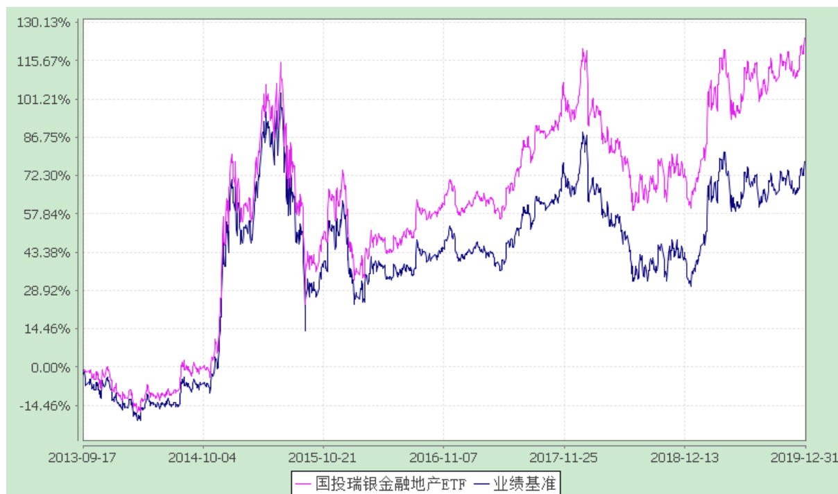
份额累计净值增长率与业绩比较基准收益率的历史走势对比图 (2013 年 9 月 17 日至 2019 年 12 月 31 日)

注：本基金建仓期为自基金合同生效日起的 3 个月。截至建仓期结束，本基金各项资产配置比例符合基金合同及招募说明书有关投资比例的约定。