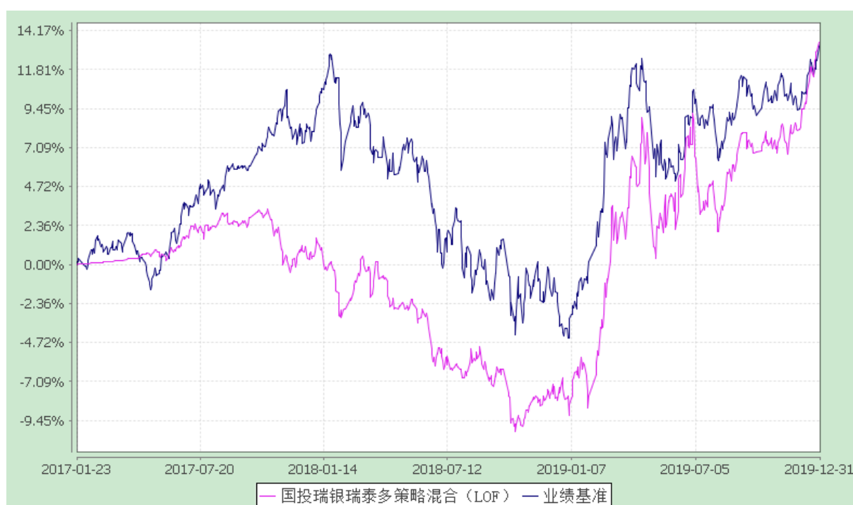
国投瑞银瑞泰多策略灵活配置混合型证券投资基金（LOF） 份额累计净值增长率与业绩比较基准收益率的历史走势对比图 (2017 年 1 月 23 日至 2019 年 12 月 31 日)

注：本基金建仓期为自基金合同生效日起的六个月。截至建仓期结束，本基金各项资产配置比例符合基金合同及招募说明书有关投资比例的约定。