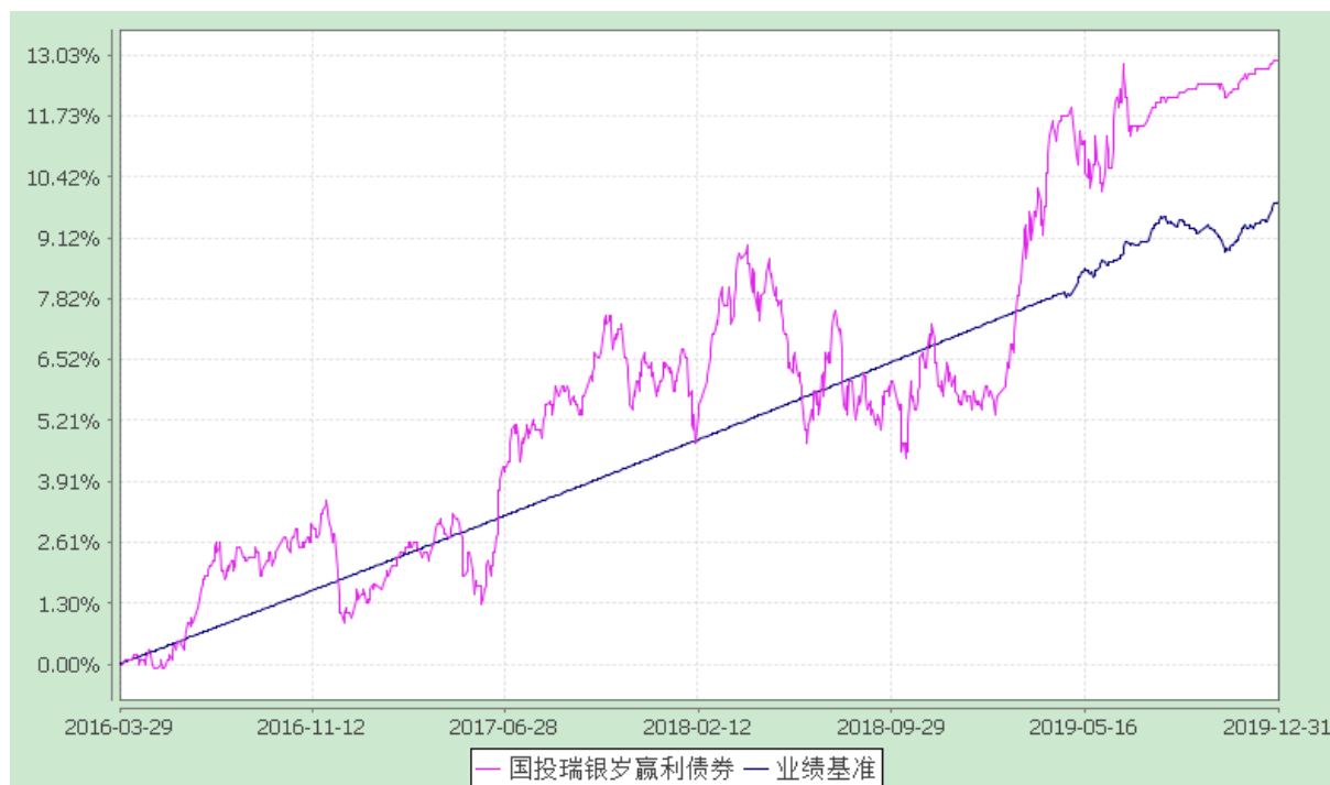
国投瑞银岁赢利债券型证券投资基金 份额累计净值增长率与业绩比较基准收益率的历史走势对比图 (2016 年 3 月 29 日至 2019 年 12 月 31 日)

注：本基金建仓期为自基金合同生效日起的六个月。截至建仓期结束，本基金各项资产配置比例符合基金合同及招募说明书有关投资比例的约定。