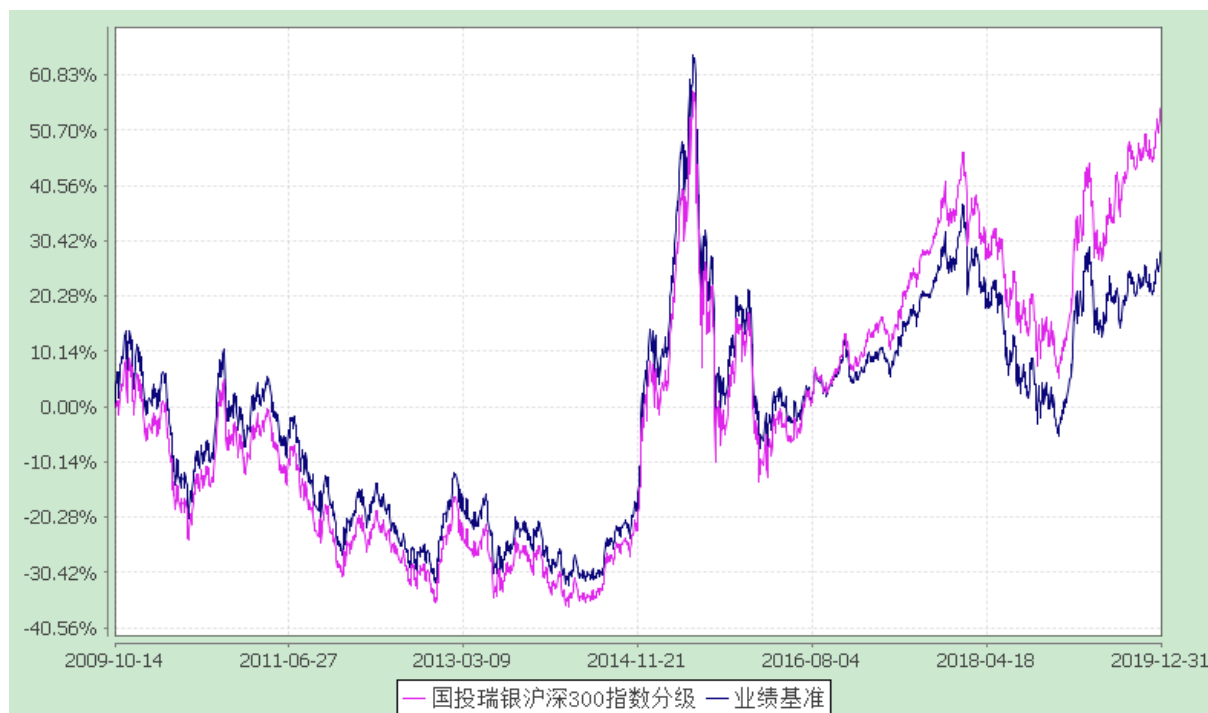
国投瑞银瑞和沪深 300 指数分级证券投资基金 份额累计净值增长率与业绩比较基准收益率的历史走势对比图 (2009 年 10 月 14 日至 2019 年 12 月 31 日)

注：本基金建仓期为自基金合同生效日起的 3 个月。截至建仓期结束，本基金各项资产配置比例符合基金合同及招募说明书有关投资比例的约定。