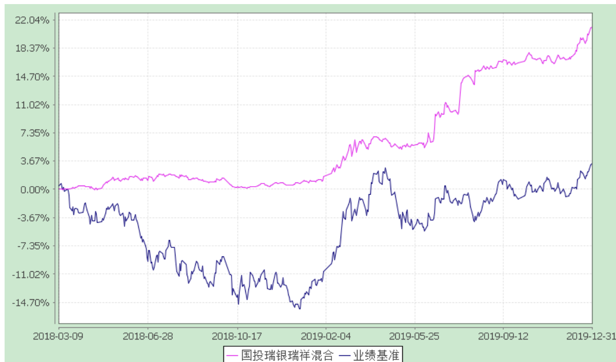
国投瑞银瑞祥灵活配置混合型证券投资基金 份额累计净值增长率与业绩比较基准收益率的历史走势对比图 (2018 年 3 月 9 日至 2019 年 12 月 31 日)

注：本基金建仓期为自基金转型日起的六个月。截至建仓期结束，本基金各项资产配置比例符合基金合同及招募说明书有关投资比例的约定。