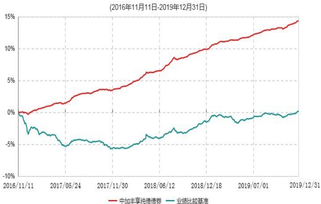
中加丰享纯债债券型证券投资基金累计净值增长率与业绩比较基准收益率历史走势对比图