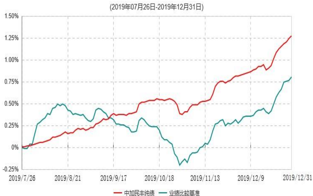
中加民丰纯债债券型证券投资基金累计净值增长率与业绩比较基准收益率历史走势对比图

注：1、本基金基金合同于2019年7月26日生效，截止报告期末，本基金的基金合同生效未满一年。