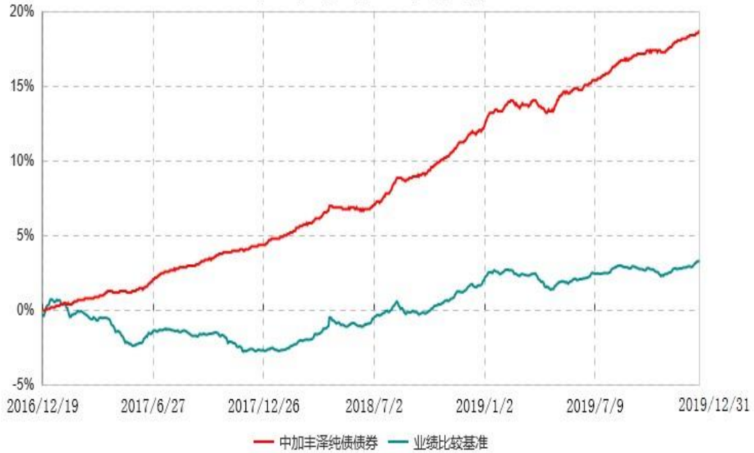
中加丰泽纯债债券型证券投资基金累计净值增长率与业绩比较基准收益率历史走势对比图 (2016年12月19日-2019年12月31日)