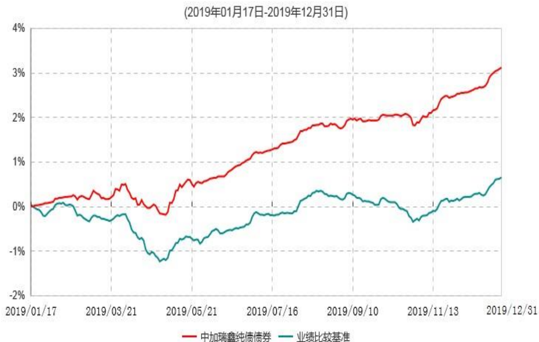
中加瑞鑫纯债债券型证券投资基金累计净值增长率与业绩比较基准收益率历史走势对比图

注：1、本基金基金合同于 2019 年 1 月 17 日生效，截至报告期末，本基金合同生效未满一年。