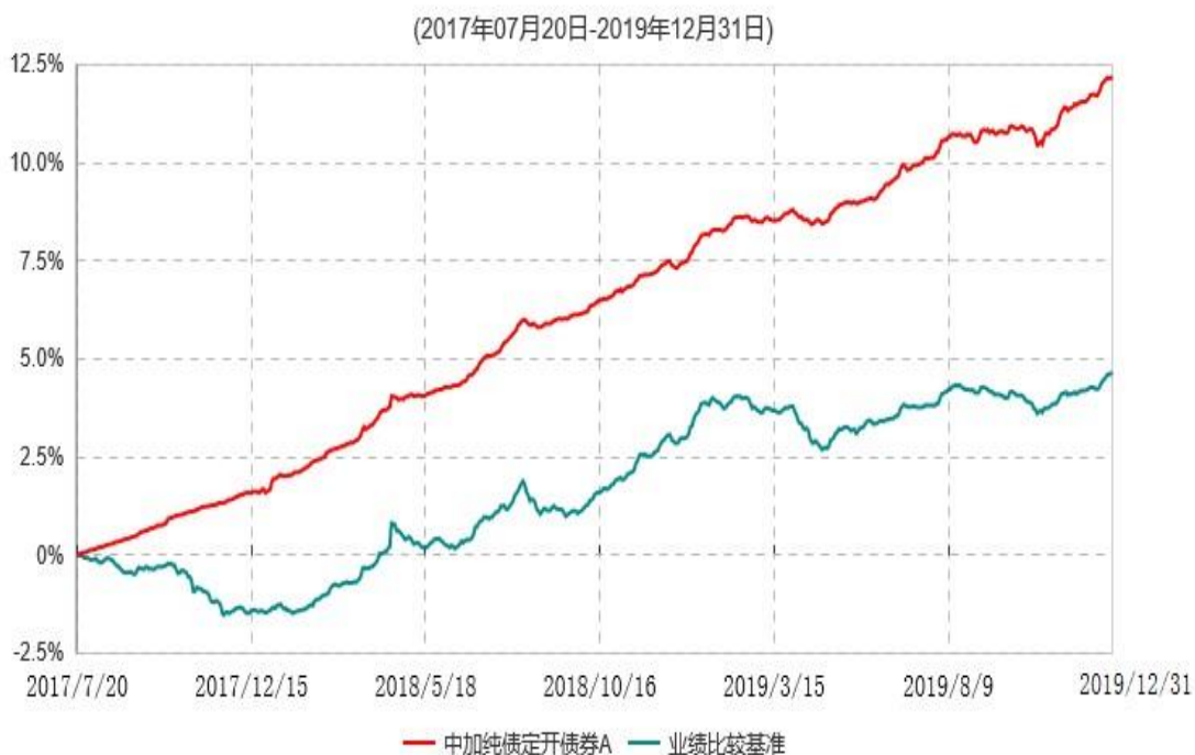
中加纯债定开债券A累计净值增长率与业绩比较基准收益率历史走势对比图