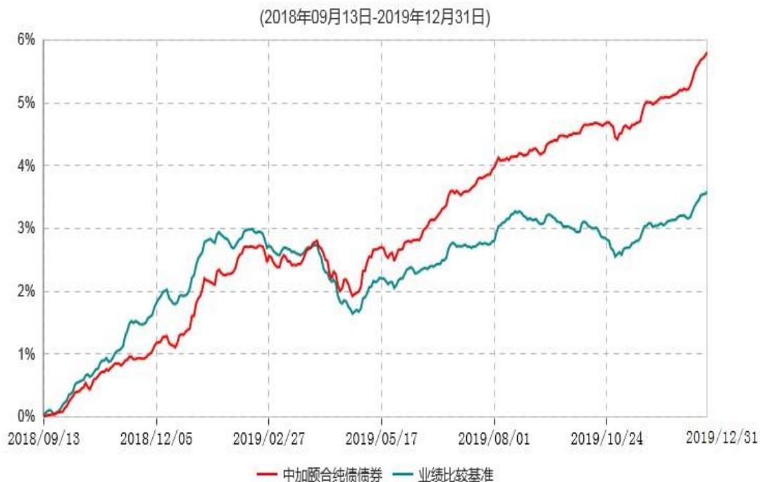
中加颐合纯债债券型证券投资基金累计净值增长率与业绩比较基准收益率历史走势对比图

注：1.本基金基金合同于2018年9月13日生效，截止报告期末，本基金基金合同生效已满一年。