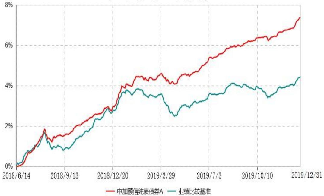
中加颐信纯债债券A累计净值增长率与业绩比较基准收益率历史走势对比图 (2018年06月14日-2019年12月31日)

注：1.本基金基金合同于 2018 年 6 月 14 日生效，截至报告期末，本基金基金合同生效已满一年。 2.按基金合同规定，本基金建仓期为 6 个月，截至报告期末，已完成建仓，本基金的各项投资比例符合基金合同关于投资范围及投资限制规定。