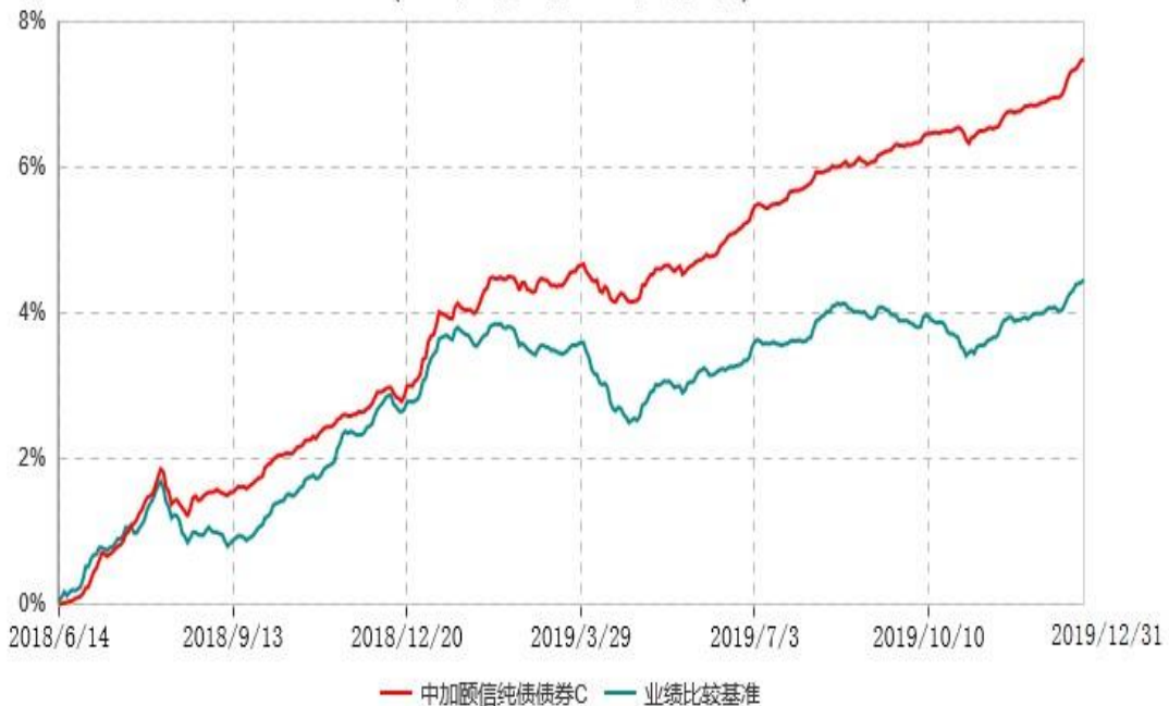
中加颐信纯债债券C累计净值增长率与业绩比较基准收益率历史走势对比图 (2018年06月14日-2019年12月31日)

注：1.本基金基金合同于 2018 年 6 月 14 日生效，截至报告期末，本基金基金合同生效已满一年。 2.按基金合同规定，本基金建仓期为 6 个月，截至报告期末，已完成建仓，本基金的各项投资比例符合基金合同关于投资范围及投资限制规定。