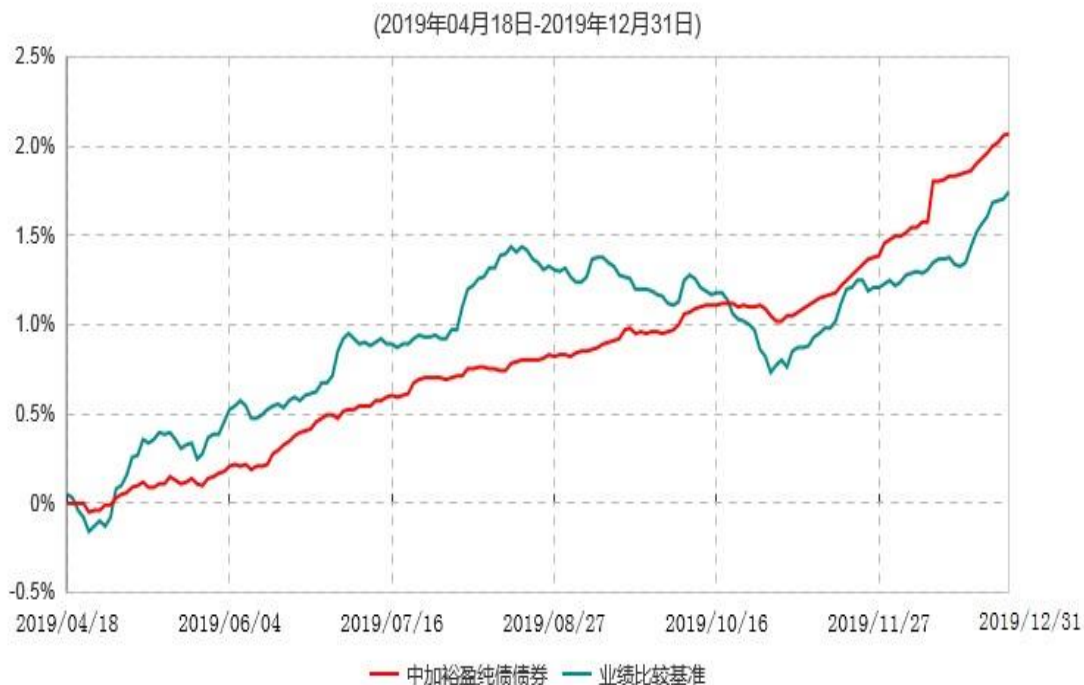
中加裕盈纯债债券型证券投资基金累计净值增长率与业绩比较基准收益率历史走势对比图

注：1.本基金的基金合同于2019年4月18日生效，截至本报告期末，本基金合同生效未满一年。