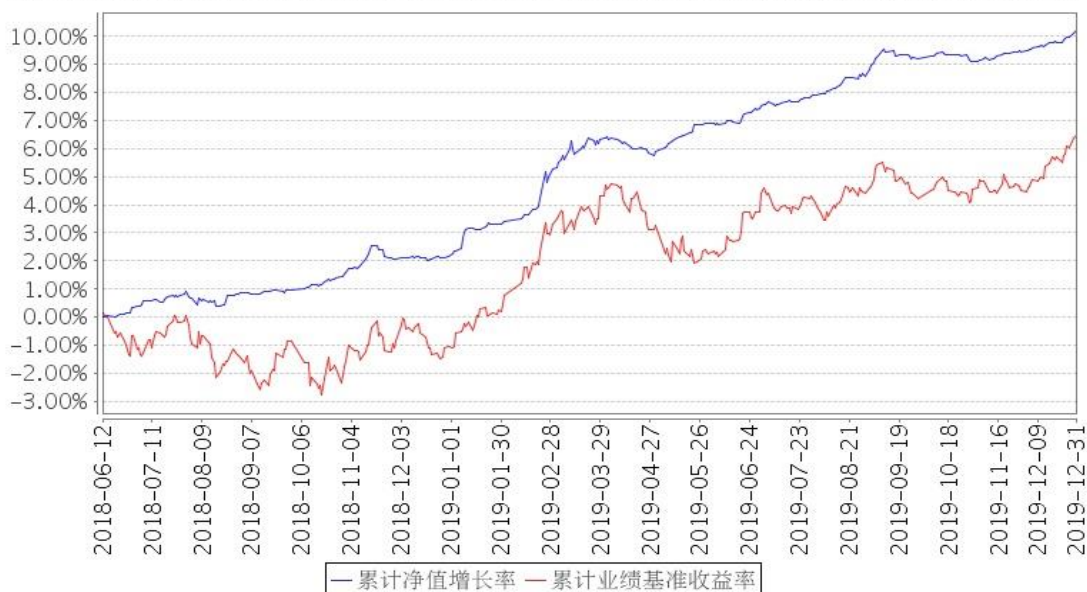
安信永鑫增强债券A累计净值增长率与同期业绩比较基准收益率的历史走势对比图