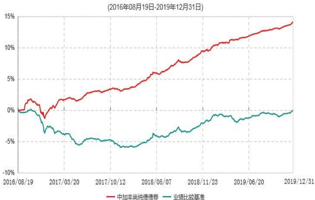
中加丰尚纯债债券型证券投资基金累计净值增长率与业绩比较基准收益率历史走势对比图