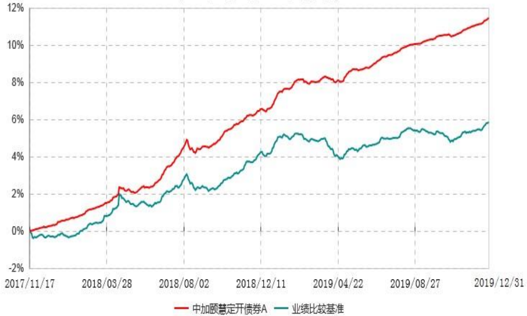
中加颐慧定开债券A累计净值增长率与业绩比较基准收益率历史走势对比图 (2017年11月17日-2019年12月31日)