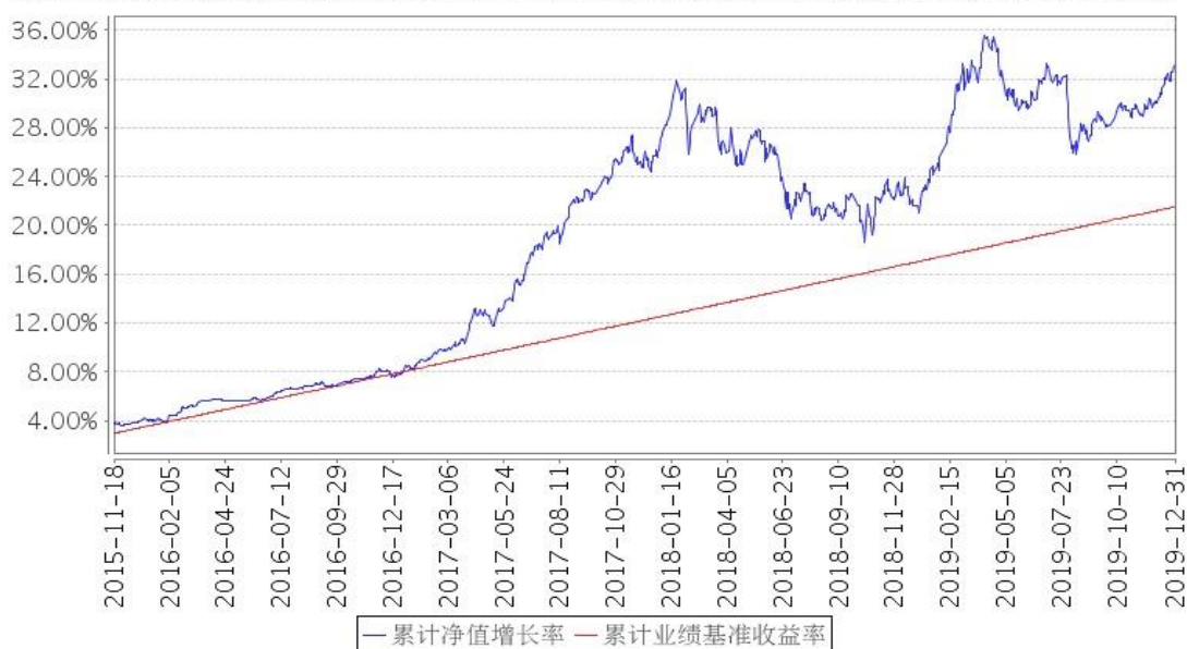
安信动态策略混合A累计净值增长率与同期业绩比较基准收益率的历史走势对比图