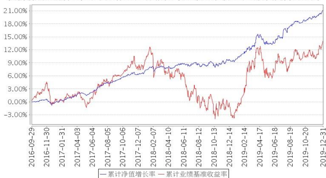
安信新成长混合A累计净值增长率与同期业绩比较基准收益率的历史走势对比图