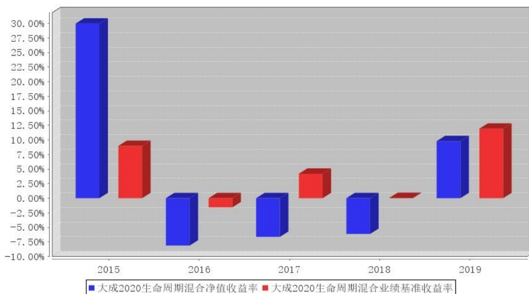
大成2020生命周期混合基金每年净值增长率与同期业绩比较基准收益率的对比图