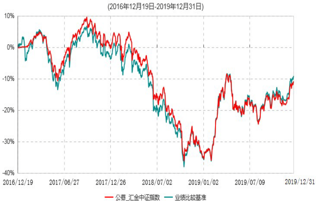
浙商汇金中证转型成长指数型证券投资基金累计净值增长率与业绩比较基准收益率历史走势对比图