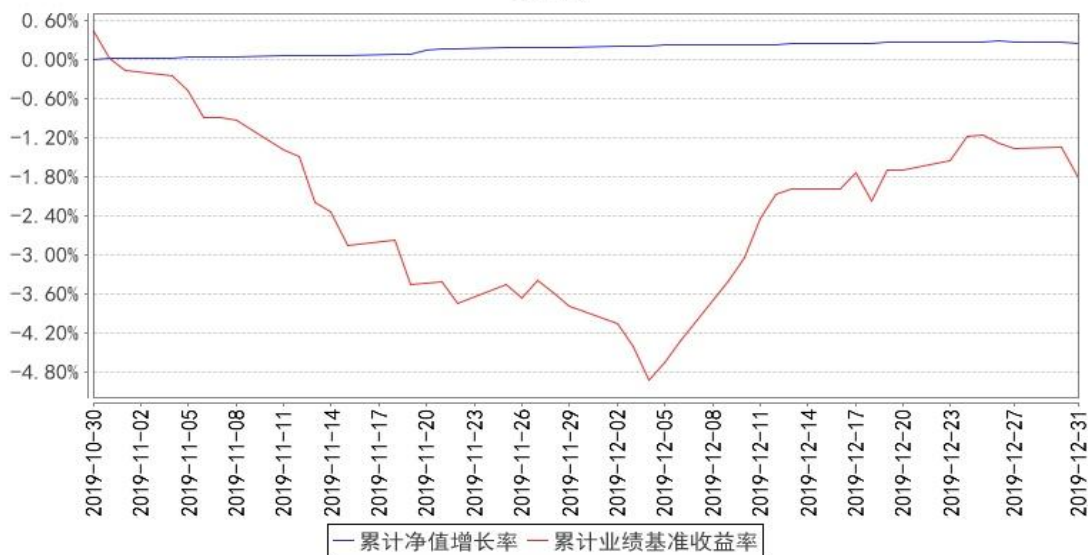
大成有色金属期货ETF联接A累计净值增长率与同期业绩比较基准收益率的历史走势对比图